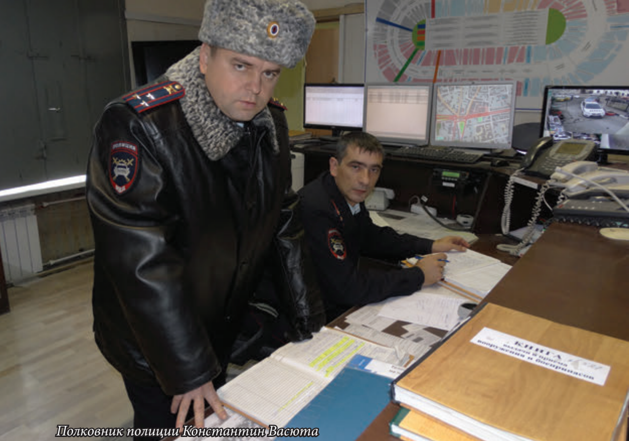
Полковник полиции Константин Васюта

нии. Для подобных «игроков» вероятная авария — всего лишь проигранная партия, а загубленная в ней чужая жизнь — разменная пешка!