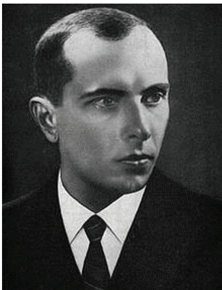
Бандера Степан Андреевич

Активно сотрудничая с польской и немецкой разведками, существуя на их средства, УВО в основу своей деятельности поставила борьбу против Советского Союза, то есть подготовку против него новой интервенции. Провокация была одним из идейных принципов в деятельности УВО. Кроме борьбы против СССР, которая проводилась путем засылки на территорию страны агентов, шпионов и диверсантов, УВО вела борьбу против революционных организаций, существовавших в Западной Украине, то есть любыми способами и средствами пыталась расширить свое влия-