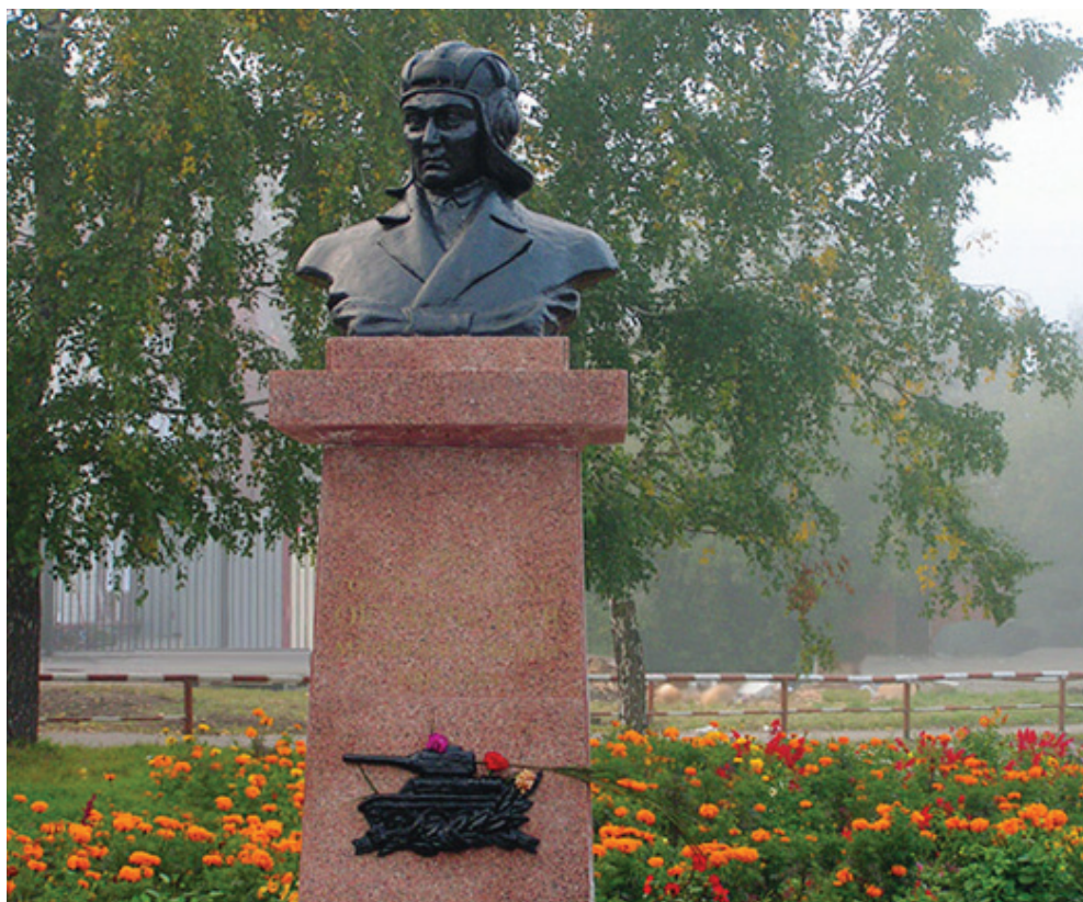
Памятник Герою Советского Союза М.В. Октябрьской в городе Томске

ния — 50 000 рублей. Танк прошу назвать «Боевая подруга» и направить меня на фронт в качестве водителя этого танка. Имею специальность шофера, отлично владею пулеметом, являюсь ворошиловским стрелком. Шлю Вам горячий привет и желаю здравствовать долгие, долгие годы на страх врагам и на славу нашей Родины». Ответ был лаконичным. «Благодарю Вас, Мария Васильевна, за Вашу заботу о бронетанковых силах Красной Армии. Ваше желание будет исполнено. Примите мой привет. И. Сталин».