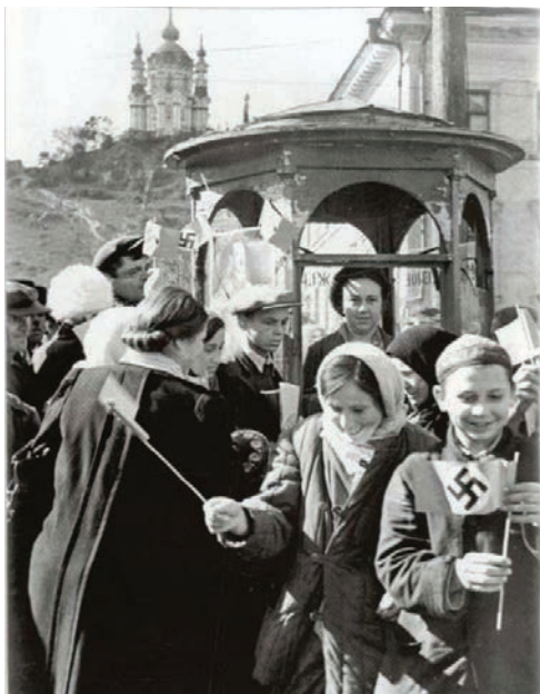
Украинские националистические организации в годы Второй мировой войны. Документы: в 2 т. Т. 1: 1939–1943 / под ред. А.Н. Артизова. М.: Российская политическая энциклопедия (РОССПЭН), 2012. — 878 с.

ОУН вела шпионскую работу в Польше в пользу Германии, в то же время сотрудничая с польским Генеральным штабом и польской разведкой, снабжала их своими людьми для