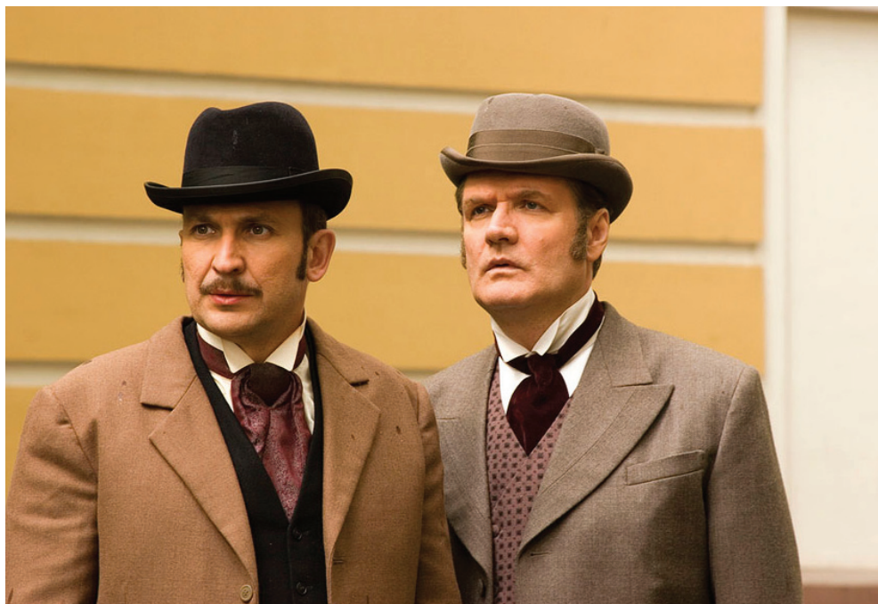
Кадр из фильма Сыщик Путилин

ский рычаг на благо государству. А сейчас все вроде нормально, но надо больше! Надо до звездного неба достать. Скромной отдачи от искусства не должно быть. Зритель должен смеяться и плакать, летать и открывать мир!