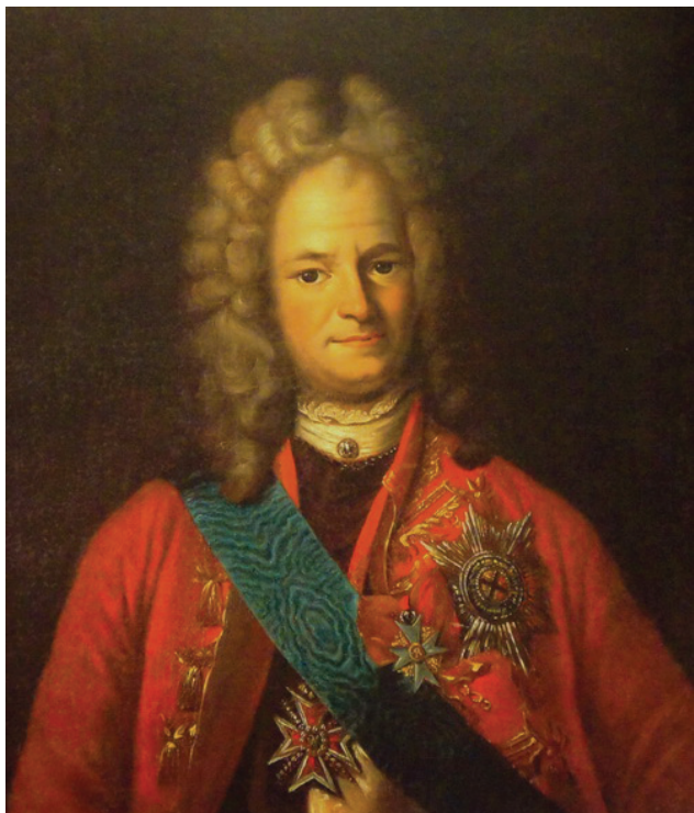
Александр Данилович Меншиков