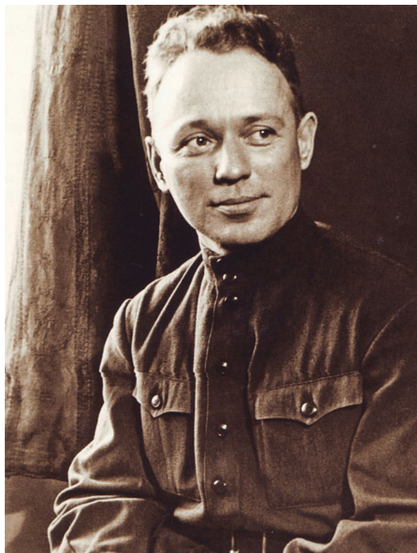
Михаил Александрович Шолохов