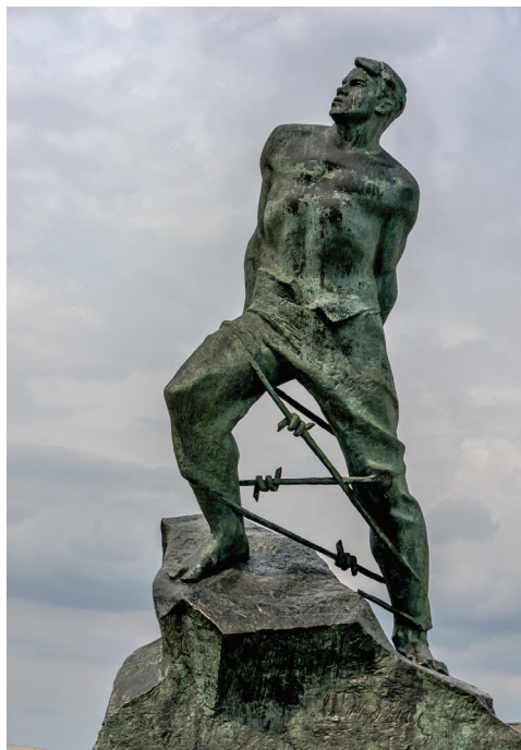
Памятник татарскому советскому поэту, Герою Советского Союза Мусе Джалилию в г. Казани

ный муфтий (я переспрашиваю, и Тиммерманс повторяет: главный муфтий). Там, в лагере, было известно, что Джалиль — писатель, и муфтий требовал от него, чтобы Муса и несколько других татар написали обращение ко всем военнопленным татарам с призывом вступить в армию генерала Власова.