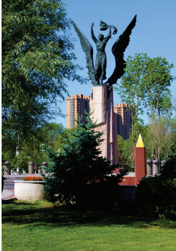
Памятник Галине Дубеевой в китайском городе Суйфэньхэ

Сегодня провинция Хэйлунцзян, граничащая с рядом субъектов Российской Федерации Дальнего Востока, — одна из самых развитых провинций Китая. Огромное значение для ее экономики имеет экотуризм. Река Сунгари и водно-болотные угодья являются главными достопримечательностями, их посещают ежегодно более