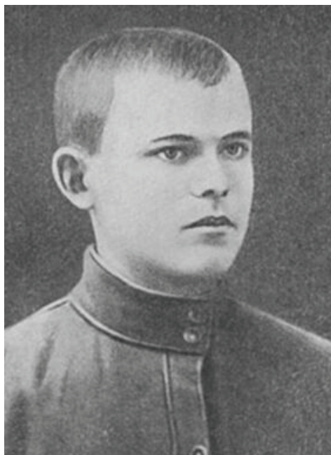
Новобранец Н.Ф. Ватутин