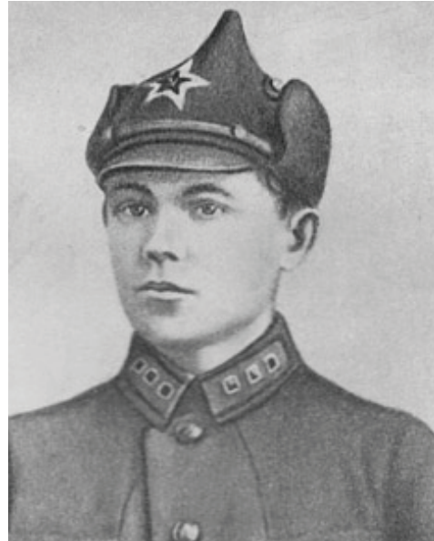
Красный командир Н.Ф. Ватутин