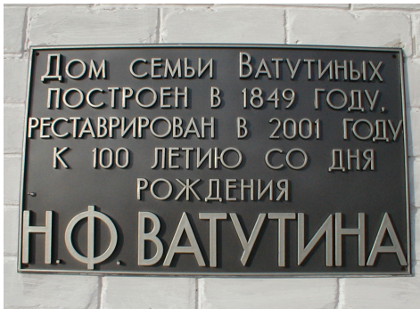
Памятная доска на доме семьи Ватутиных