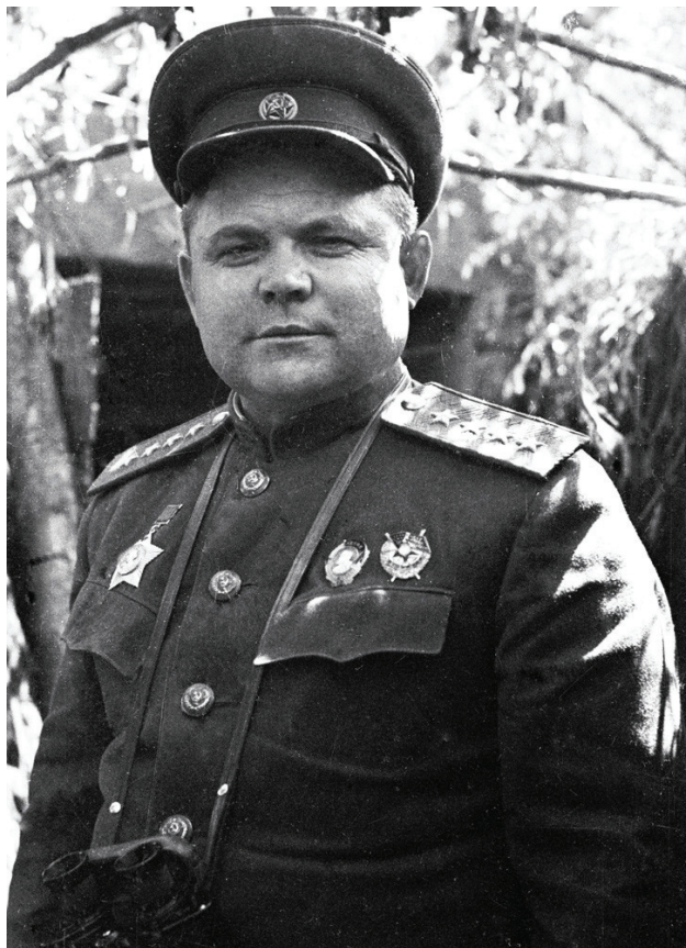
Николай Федорович Ватутин

«Однажды мы с ним (Ватутиным. — Н.К.) отправились в войска первой линии, решив проверить организацию питания бойцов. И вот возле одной из походных кухонь генерал Ватутин обратил внимание на разбросанные хлебные корки и объедки. Он сразу нахмурился, посуровел и, обратившись к сопровождавшему нас командиру, приказал собрать личный состав. Затем, когда его распоряжение было выполнено, командующий фронтом, генерал армии, сам в дет-