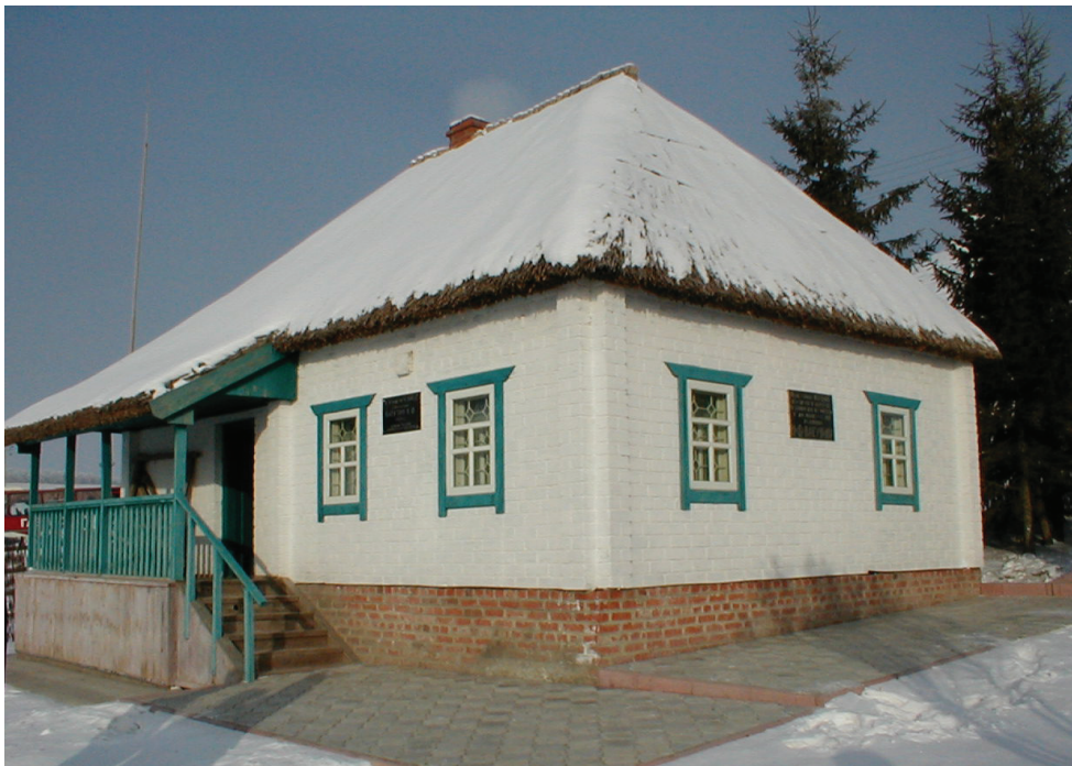
Дом в селе Чепухино (в настоящее время — село Ватутино), где родился Н.Ф. Ватутин