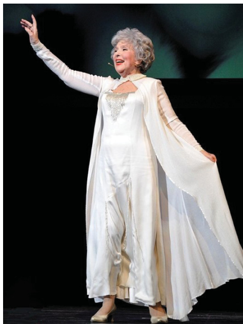
Вера Васильева на сцене

Однако особую приверженность я испытываю к классике. И уверена, что в современных постановках классических произведений нужно избегать дешевого желанья вызвать зрительский интерес любой ценой. Я все-таки хотела бы, чтобы те, кто берется ставить великую литературу, больше тянулись к постижению ее глубины и художественного совершенства. При этом сегодняшнее время диктует и новый язык, и большую сдержанность при интенсивности чувств — архаичные и трафаретные постановки, конечно, не нужны зрителю. Они не получают отклика и не будут выполнять свою главную задачу — воспитание души. Вот об этом и должны думать режиссеры и артисты.