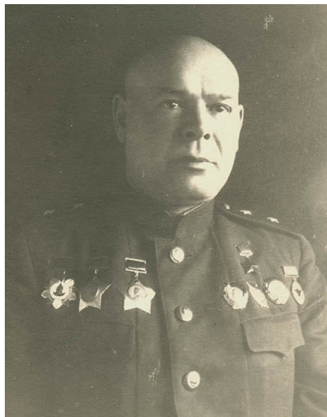
Герой Советского Союза генерал-лейтенант Николай Павлович Пухов, командующий 13-й армией

29 февраля 1944 г., закончив работу в штабе 13-й армии, в 16.30 т. Ватутин выехал в район расположения штаба 60-й армии в г. Славута.