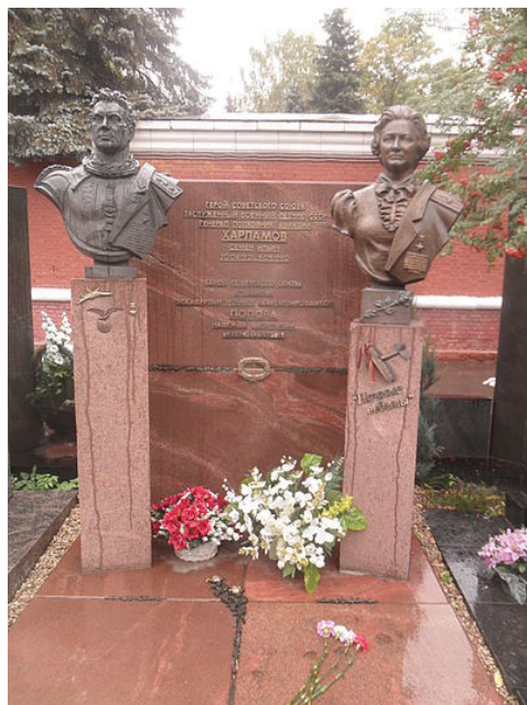
Памятник Героям Советского Союза Надежде Васильевне Поповой и Семену Ильичу Харламову на Новодевичьем кладбище в Москве

А ведь скидок на то, что машинами управляют девочки, девчонки, не было. Как модно сейчас говорить, картина маслом: у одного из экипажей осталась неиспользованной светящаяся авиабомба, которую штурман, державший ее на коленях, выбрасы-