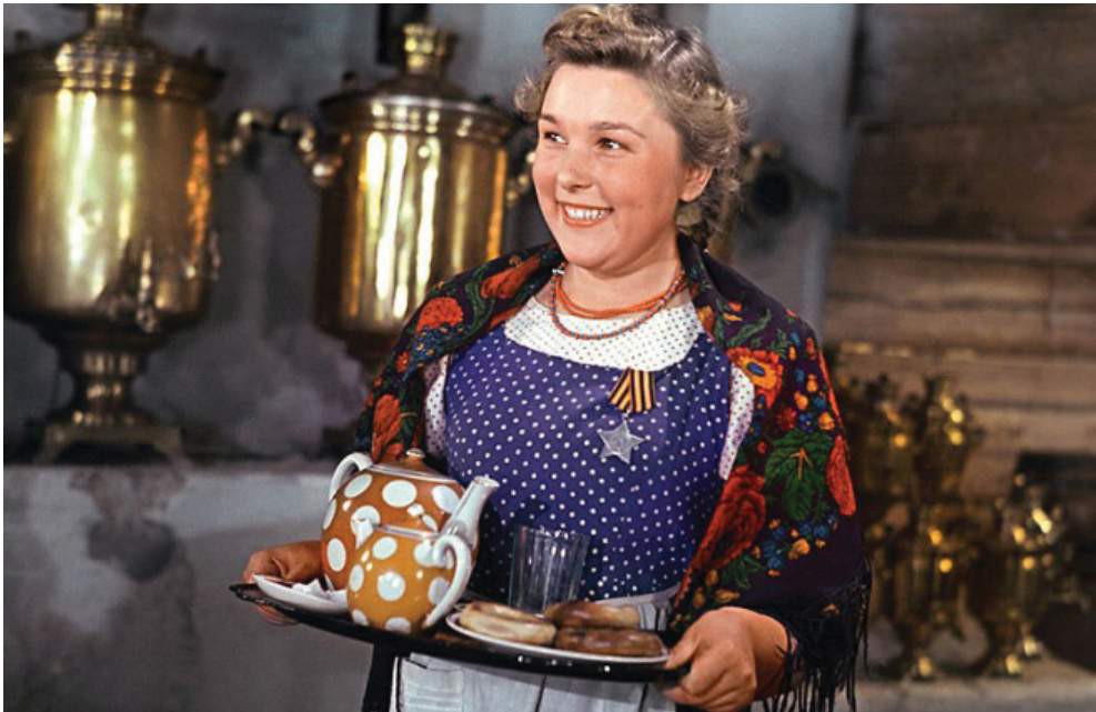
Вера Васильева в фильме «Сказание о земле Сибирской»

— Как вы думаете, когда к вам пришло признание?