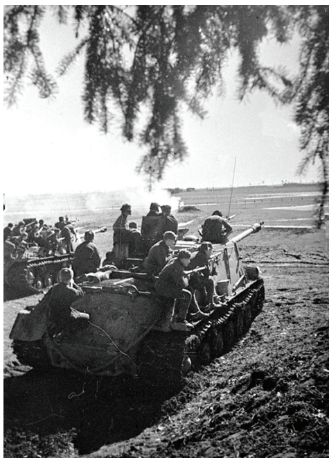
Март 1945 г.

вывели ее к своим с пустой боеукладкой и без патронов в личном оружии.