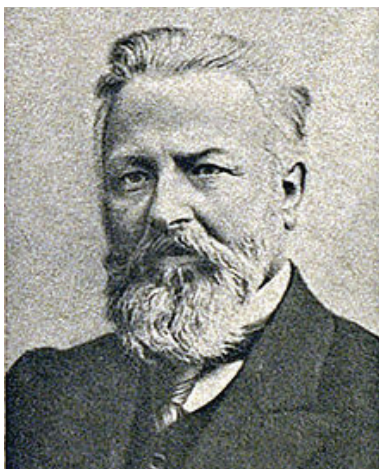
Михаил Степанович Ольминский

Если мы поинтересуемся прежними биографиями других деятелей советской эпохи, то непременно споткнемся о те же эпитеты: пламенный, непримиримый, самоотверженный, беззаветный. Можно еще добавить из этого набора: неустанный, самоотверженный, преданнейший. За подобным набором слов невозможно увидеть личность, ее индивидуальность. Не отсюда