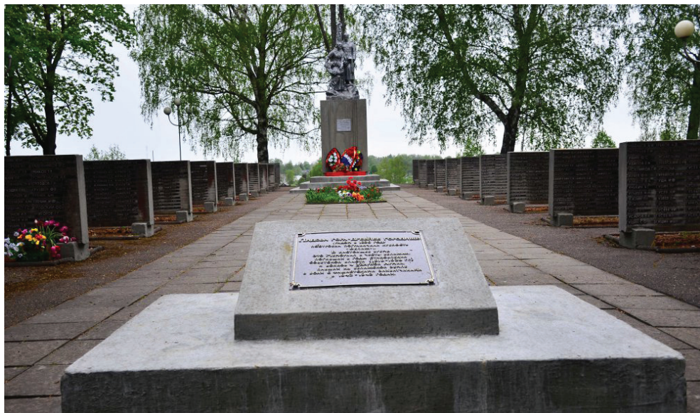
Мемориальный комплекс в городе Велиж Смоленской области. Здесь, в братской могиле, покоится прах героя