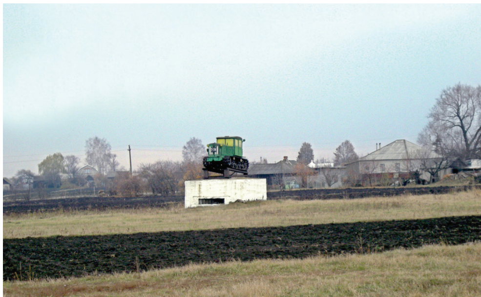
Трактор на пьедестале у села Круглое Красненского района Белгородской области, памятник односельчанам — героям ратного труда и трудовых буден

Подкрашенный, поношенный трактор не отличается особым изяществом. Пейзаж обыденный — сельские огородики да чистое поле. Его авторы — не специалисты, выполнившие официальный заказ, а обыкновенные, от земли, сельские жители. Если и работали по заказу — то по заказу сердца. По всем показателям — народный памятник! На благоухающем клеверном разноцветье или на созревшей хлебной ниве, на изумрудных всходах озими или на цветущей плантации подсолнечника трактор на бетонном доте смотрится эффектно, будто обеспечивая это цветение и охраняя его покой. И это трогает больше всего: неказистая поношенная машина, водруженная на дот, как мне кажется, очень