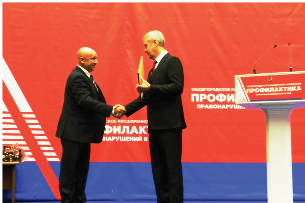
Мэр Москвы С.С. Собянин вручает Почетную грамоту В.К. Каверзину

щественные пункты охраны порядка. Применять же физическую силу разрешено в пределах права на необходимую оборону.