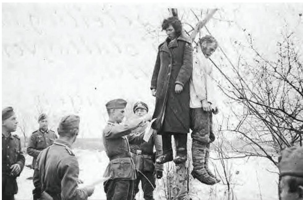
А это обычное дело фашистов. Фотография была найдена у убитого оккупанта