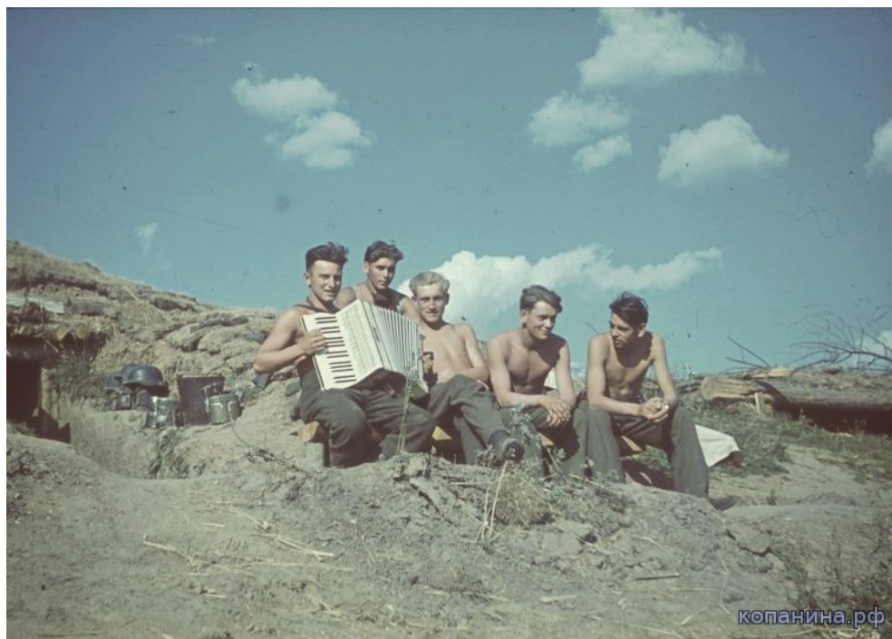
Так представляет своих сослуживцев-окупантов немецкий фотограф Франц Грассер

Другая тоже вполне очевидная тенденция — «лакировка» фашизма и фашистов. Довелось читать, будто такие авторы учли опыт создателей фильма «17 мгновений весны», принесшего им успех. Что сказать в ответ? Там, может быть впервые в отечественном кинематографе, все эти Мюллеры и Борманы показаны людьми. Но людьми, фашистское нутро которых несовместимо с библейской сущ-