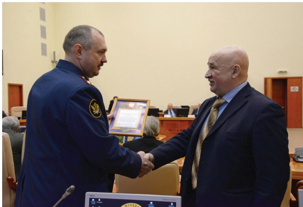
Награда от МВД России

Но не возбраняется увеличивать ее численность.