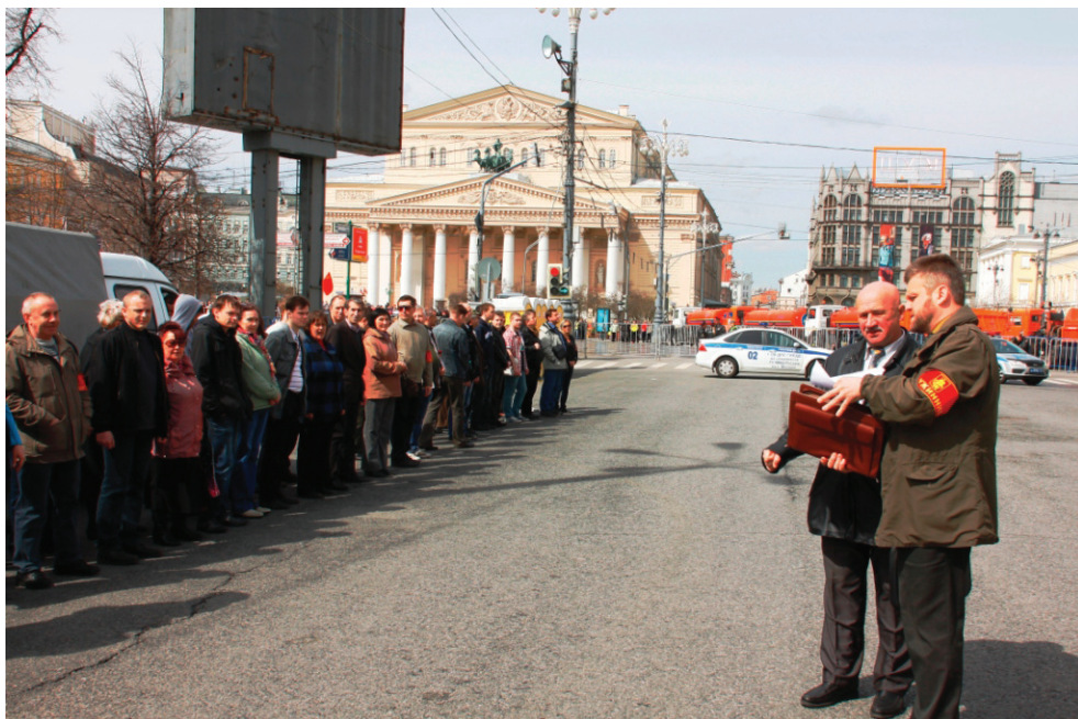
Идет инструктаж дружинников перед выходом на дежурство

ков также не имеет жестких ограничений, но основное ядро — люди 35–45 лет. Мы проводим довольно жесткий отбор кандидатов. Первый и главный пункт — это отсутствие фактов привлечения к административной ответственности и уж тем более судимости за уголовные преступления. Иными словами, мы строго руководствуемся рамками федерального закона, в котором участие граждан в охране общественного порядка осуществляется в соответствии с принципами добровольности, законности.