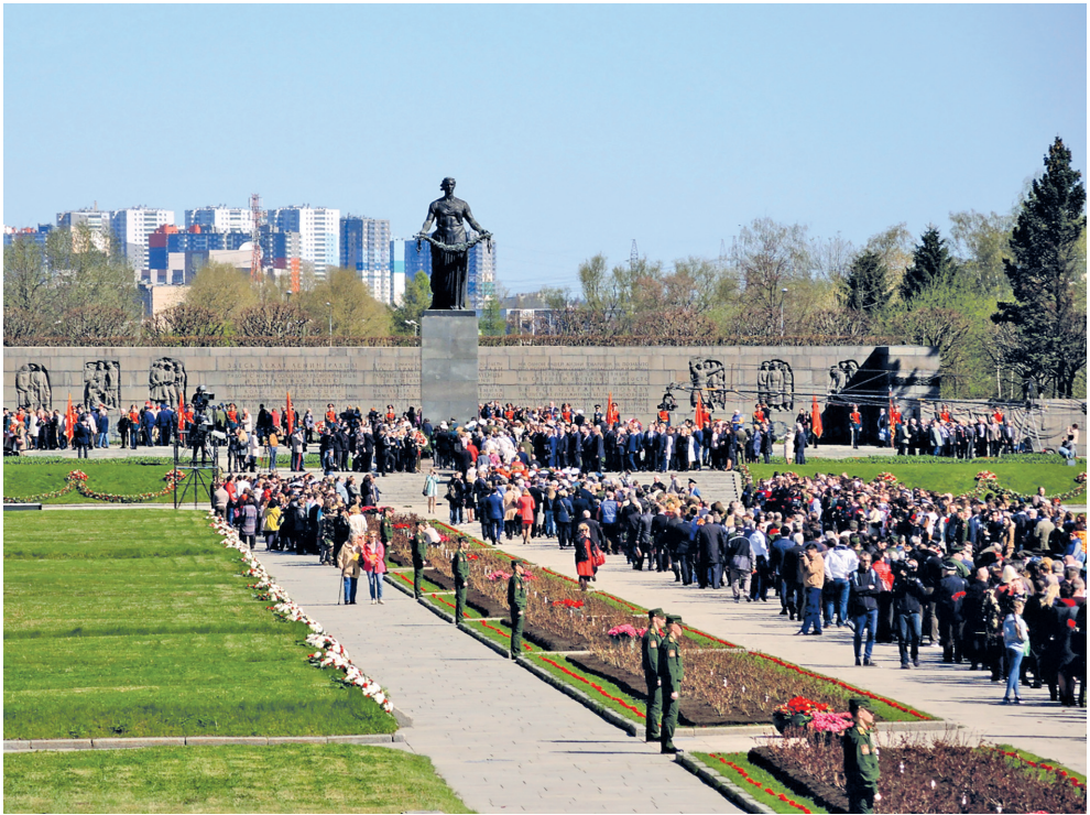
Пискаревское мемориальное кладбище, на граните которого выбиты бессмертные слова Берггольц

Был закрыт музей обороны и блокады Ленинграда, из магазинов незаметно начинают исчезать ее книги. Отказ заклеить Ахматову, которую считала своим учителем, обернулся удалением из правления Ленинградского отделения Союза писателей, из редсовета издательства, вычеркнули из списка «Золотой серии» книгу «Избранное», которая должна была быть издана к 30-летию Октябрьской революции.