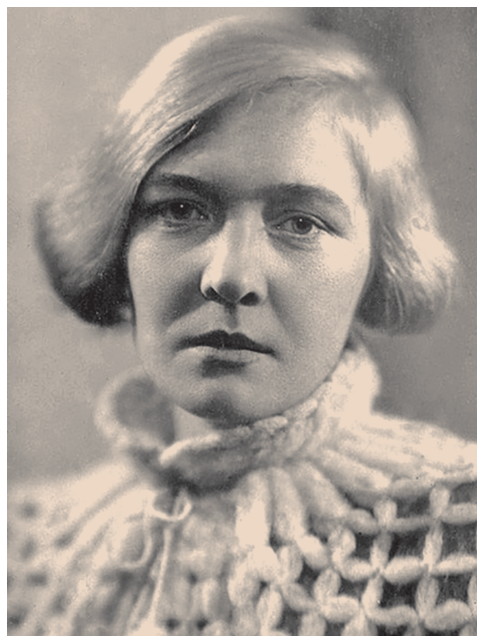
Ольга Федоровна Берггольц

Веду речь о поэтессе Ольге Берггольц, отстаивая право на трагедию художника вообще, она одновременно отстаивала свое право на этот в те поры не очень «фото-