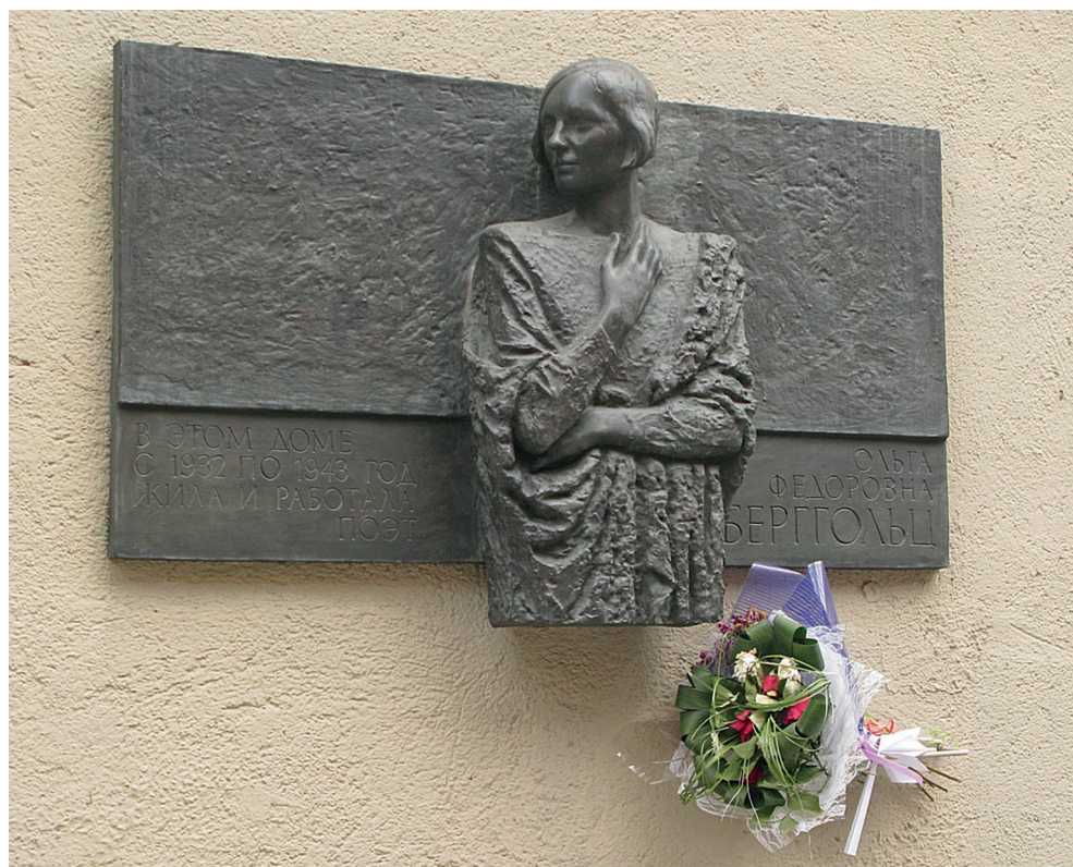
Мемориальная доска в Санкт-Петербурге на доме, в котором жила поэтесса

Как вопль. Как Мефистофель. Он вырастал из пучины времени медленно, неповоротливо, угрожающе, наводя ужас арестами, исключениями из партии, поисками врагов народа, которые начались еще раньше.