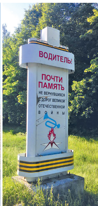
Знак перед памятником