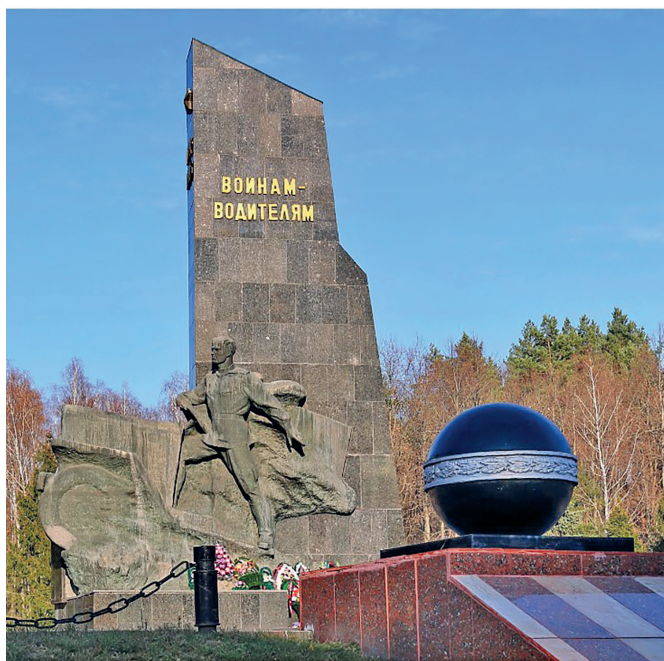
Фрагменты мемориала воинам-водителям, участникам Великой Отечественной войны, под Брянском

Бывало, приедешь в указанный квадрат, посмотришь по сторонам — должна стоять батарея, а ее нет. Чувствуешь по времени, что артиллеристы далеко не должны были уйти. Вот и начинаешь гонять по позициям, искать свою батарею. Кругом грохот, разрывы бомб