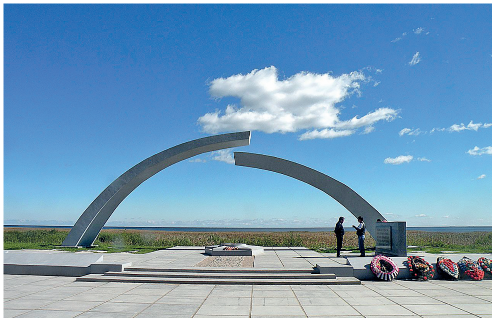
Мемориал «Разорванное кольцо» на 40-м километре «Дороги жизни» (Ленинградская область)

выкатилось из-за горизонта, озолотив раненое поле и спасительный лес.