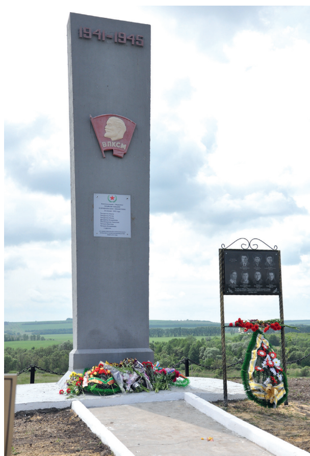
Мемориальная плита и обелиск на месте последнего боя Марьевского комсомольского истребительного отряда

Призыв с газетной трибуны услышали учащиеся Алексеевского профтехучилища № 4 (ныне агротехнический техникум).