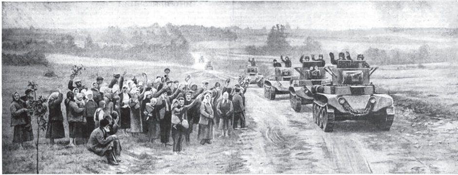
По городам и селам Западной Белоруссии. Крестьяне восторженно встречают части Красной армии в районе Гродиска.

Вчера доблестные части Красной армии заняли города Гродно, Ковель и Львов. С 17 по 20 сентября захвачено в плен свыше 60.000 польских солдат и офицеров. Занят ряд укрепленных районов с полным вооружением, артиллерией и боеприпасами. Повсеместно население Западной Украины и Западной Белоруссии восторженно встречает свою освободительницу — Красную армию, оказывая ей содействие и помощь.