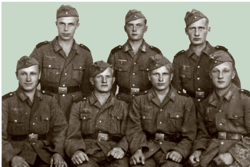
Вояки из Нахтигала

3. Создавать подобные военным формирования, которые будут служить немецким войскам в качестве проводников и переводчиков, собирать группы украинцев согласно их политическим убеждениям и встраивать их в эти свои формирования.