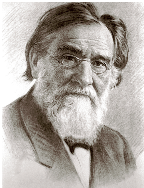
Лауреат Нобелевской премии Илья Ильич Мечников

За нынешним самопожертвованием медицинских коллективов видятся оживающие традиции наших великих медиков. Илья Ильич Мечников в их числе. В литературе о нем много поверхностно-наносного. Отец, отпрыск молдавских бояр, любил карты и спиртное. Промотав приданое жены, вынужден был осесть в скромном имении в Харьковской губернии, где в 1845 году пятым ребенком и появился на свет Илюша. Поэтому некоторые черты характера Ильи Ильича авторы объясняют наследственностью. Нет нужды опровергать или подтверждать эти утверждения. Слитков из чистого золота в природе не существует, они обязательно должны иметь примеси. Были они и у Ильи Ильича. Да и есть ли смысл педалировать, допустим, на его нервозности, вспыльчивости? В конечном счете, человека ценят не за дистиллированность характера,