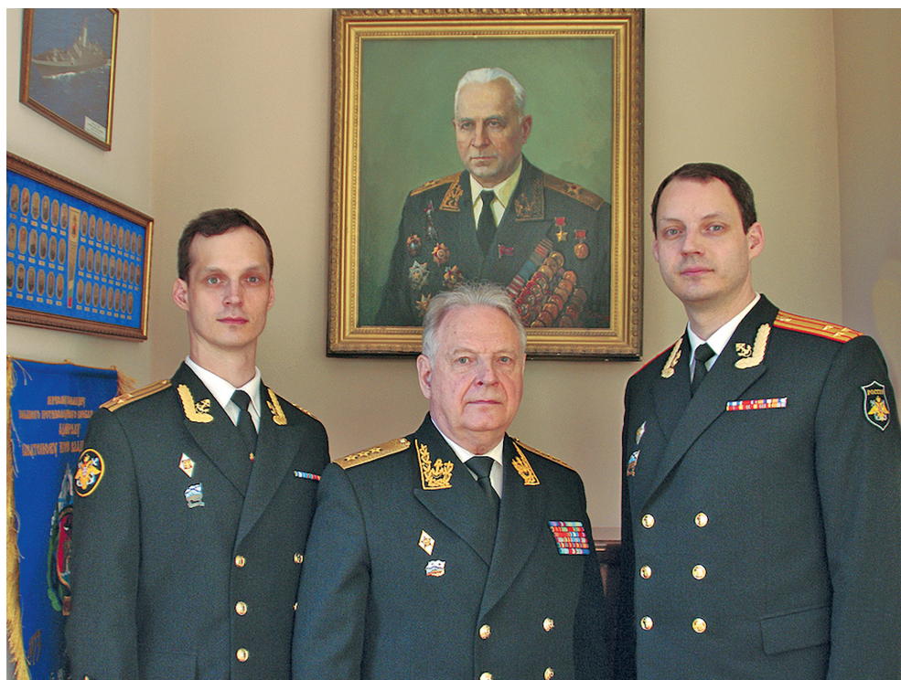
Адмирал Игорь Владимирович Касатонов с сыновьями Александром и Кириллом

спокойно, уверенно. Все-таки у меня опыт командования солидный, общению с любой аудиторией обучен. Я сказал, что флот сохранит статус-кво до выработки политического решения на уровне президентов двух стран — России и Украины, напомнил, что у нас служат представители 46 национальностей, что украинцев среди офицеров лишь девятнадцать процентов, а среди матросов и старшин — около тридцати. Я заявил с трибуны Рады, что требование принимать присягу чужого государства считаю преступным». И опять — как бы от своего имени.