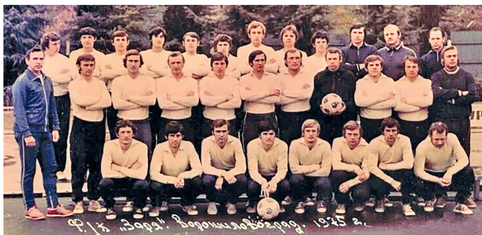
Обладатели «Приза справедливой игры» журнала «Человек и закон» футболисты футбольной команды «Заря» (Ворошиловград), 1975 г.