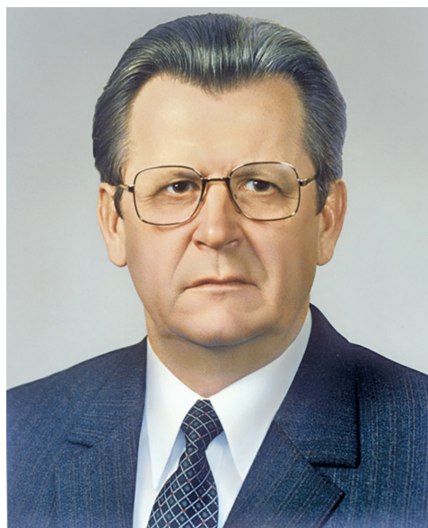
Видный государственный деятель

Когда в особо торжественных случаях в Москве проходят военные парады с участием авиатехники, над моим домом пролетают стратегические бомбардировщики Ту-95. Кажется, что солидностью, силой, каким-то особым достоинством они напоминают человека, который немало сделал для того, чтобы эти машины, долгие годы олицетворяющие мощь Отечества, поднялись на крыло. Имею в виду Виталия Ивановича Воротникова, который входит в негласную колонну руководителей партии и страны, называемых государственниками. Воротников, сказали бы теперь, был своеобразным карьеристским мачо (хотя карьеристом никогда не был), человеком, для которого не существовало никаких должностных преград. Или почти никаких. Начав трудовой путь учеником слесаря на воронежском предприятии, он поднялся на головокружительную высоту, став Председателем Совета Министров РСФСР, Председателем Президиума Верховного Совета РСФСР, попутно «прописавшись» среди членов Политбюро ЦК КПСС, Героев Социалистического Труда.