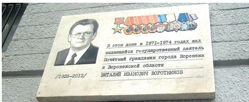
Мемориальная доска на доме, где жил В.И. Воротников

яснил решение так: «Некоторые мои коллеги стараются демонстрировать бурную деятельность. У меня другой подход. Обстановка в стране сложная, требуется максимальное напряжение, серьезная корректировка позиции. Работать вполсилы не могу, а по некоторым направлениям и не хочу». Позднее он охарактеризует времена перестройки коротко и емко — абсурд. Следует, пожалуй, добавить: в одиночку против команды Горбачева сражаться не имело смысла, а своей команды, способной действительно взять на себя ответственность за судьбу страны, у него тогда не было.