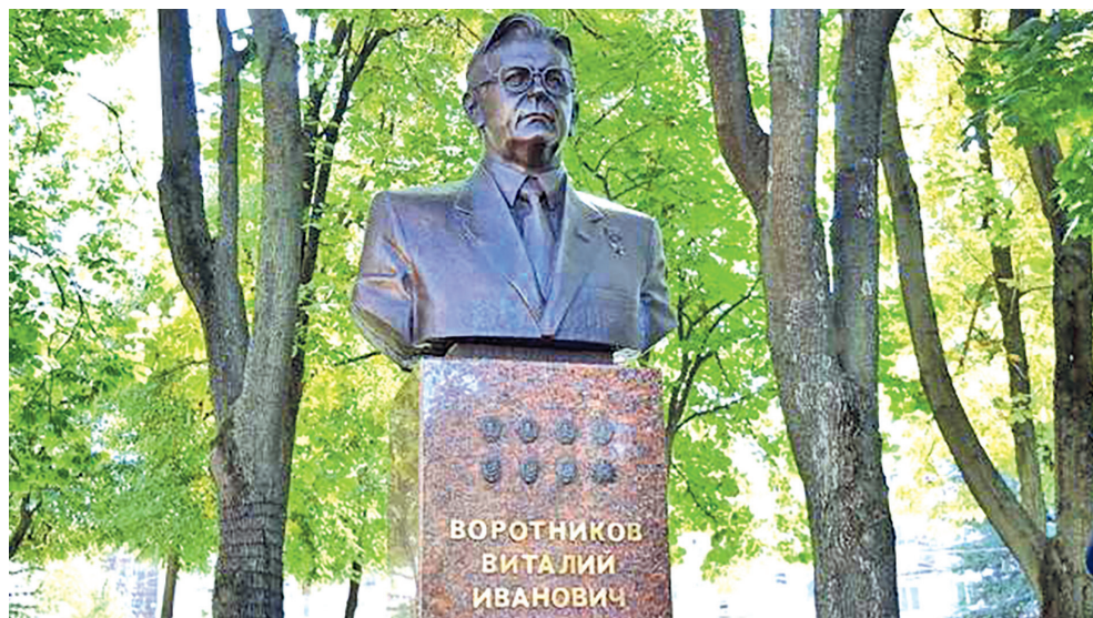
Памятник В.И. Воротникову. Ленинский район, г. Воронеж

В 1990 году Воротников по собственной инициативе ушел в отставку с поста Председателя Президиума Верховного Совета РСФСР, а затем сложил полномочия депутата Верховного Совета РСФСР. Устал? Решил уклониться от борьбы, как говорят, отсидеться в кустах? Не будем гадать. Вручая Горбачеву заявление об отставке, Воротников объ-