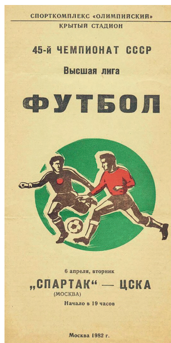
Афиша чемпионата СССР

В разные годы «Приз справедливой игры» получали «Спартак» (Москва), «Торпедо» (Москва), «Днепр» (Днепропетровск), «Шахтер» (Донецк), «Пахтакор» (Ташкент), «Арарат» (Ереван). Еще один интересный факт. За всю историю футбола приз журнала только