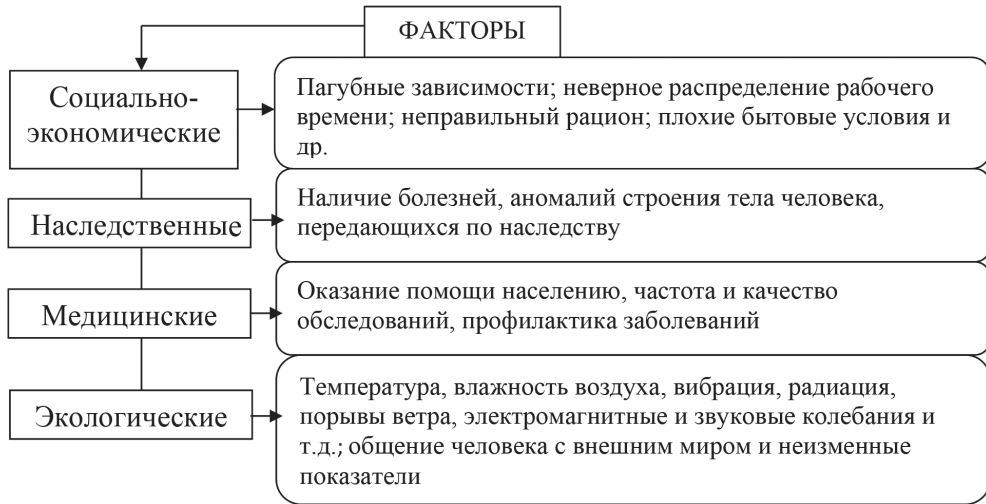
Схема 1. Факторы, негативно влияющие на состояние здоровья человека

Вопросами здоровья человека занимаются такие науки, как санология (об общественном здоровье, его охране, укреплении, умножении и воспроизводстве), валеология (о здоровье здорового человека), гигиена (условия сохранения и укрепления здоровья), анатомия патологическая (морфология больного человека), экология человека (взаимодействие человека, его организма с факторами окружающей среды), нутрициология (питание человека), диетология (о рациональном питании) и многие другие.