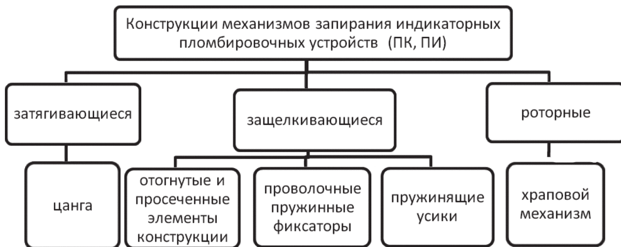
Рис. 1. Классификация индикаторных пломбировочных устройств по механизму запираения

Таким образом, имея представление о функциональных особенностях механизма запираения индикаторных пломб, эксперт может установить его техническое состояние (работоспособность) на момент исследования. Техническое состояние определяется наличием всех элементов механизма запираения, их правильным положением и взаиморасположением, отсутствием деформации и поломок, правильным сопряжением согласно техническим условиям сборки конкретной модели ПУ. Это способствует правильному и обоснованному решению вопросов, поставленных перед экспертом, в том числе по установлению наличия или отсутствия факта несанкционированного снятия и повторного навешивания индикаторного пломбировочного устройства.