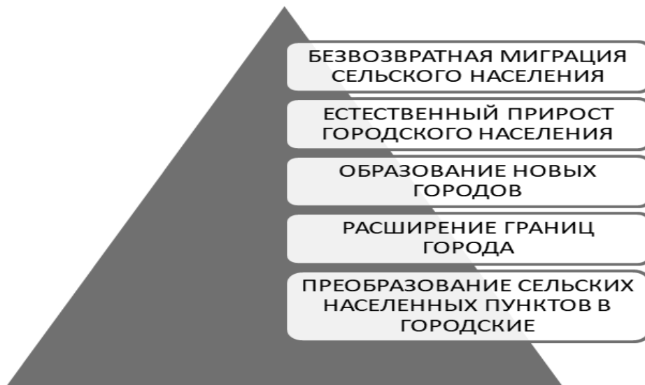
Рис. 1. Главные факторы развития процесса урбанизации

Анализ данных таблицы показывает, что до начала XIX в. доля городского населения в мире была столь незначительна (по оценкам от 3 до 5,1%) и росла такими низкими темпами, что влияние этого процесса было минимальным.