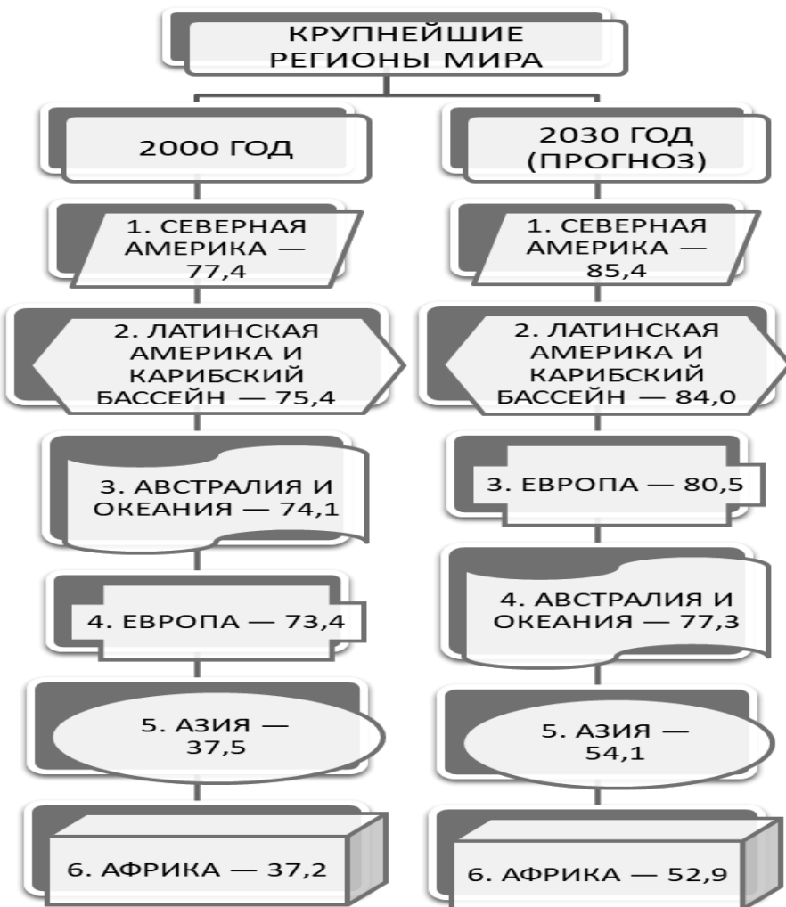
Рис. 2. Современное и прогнозное ранжирование регионов мира по уровню урбанизации

ления в результате «выталкивания» в города сельского населения из перенаселенных аграрных районов. При этом количество предлагаемых в городе мест работы значительно ниже спроса, поэтому часть сельских мигрантов становятся бездомными.