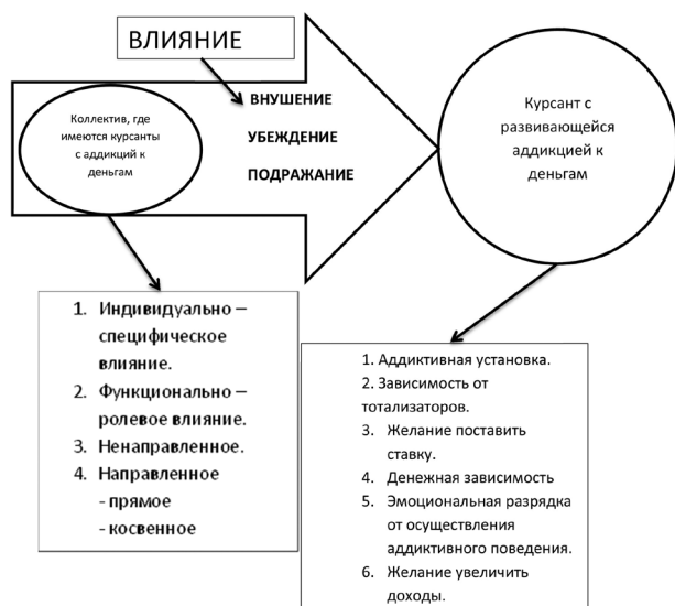
Рис. Теоретическая модель исследования механизма влияния воинского коллектива на становление аддикции к деньгам у военнослужащего (на примере курсантов)

На данной схеме отражены механизмы влияния воинского коллектива на личность, у которой развивается аддикция к деньгам.