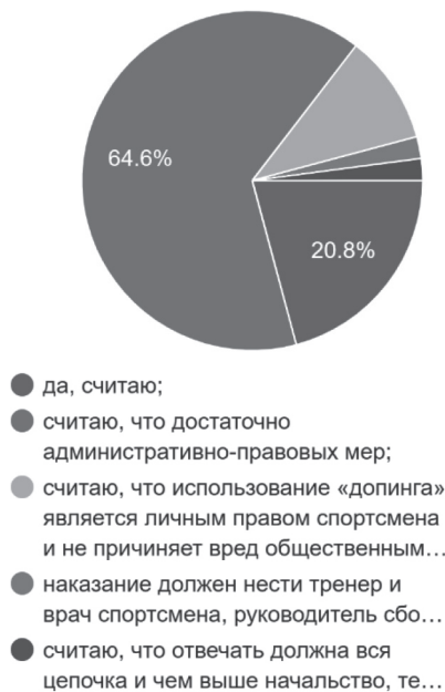
Рис. 4. Считаете ли вы, что за употребление спортсменом «допинга» должна наступать уголовная ответственность?

каждого пятого из числа опрошенных (20,8%), за употребление спортсменом «допинга» должна наступать уголовная ответственность (см. рис. 4).