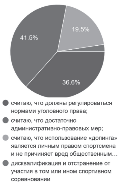
Рис. 2. Какими нормами, по вашему мнению, необходимо регулировать деяния, связанные с использованием «допинга» лично спортсменом?

Между тем последнее обстоятельство настораживает, поскольку, как нам представляется, может стать фактором, способствующим распространению наркомании среди спортсменов.