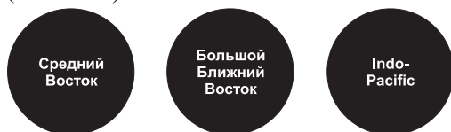
Рис. 1. Эволюция моделей мирового доминирования на основе морского превосходства

Одна из самых известных и изученных – модель Среднего и Ближнего Востока (регион между Индией и Аравийским полуостровом), описанная А. Мэхэном в 1902 г., по сути, совпадает с рельефом Indo-Pacific , но более миниатюрная и с другим «младшим союзником». С1995 г. Средний и Ближний Восток «вместе с Ираном и Афганистаном именуется ...Большой Ближний Восток» 7 . Пространственные аналогии не оставляют сомнений, что Indo-Pacific – глобальная итерация британской модели Средний Восток (см. Рис. 1 ).