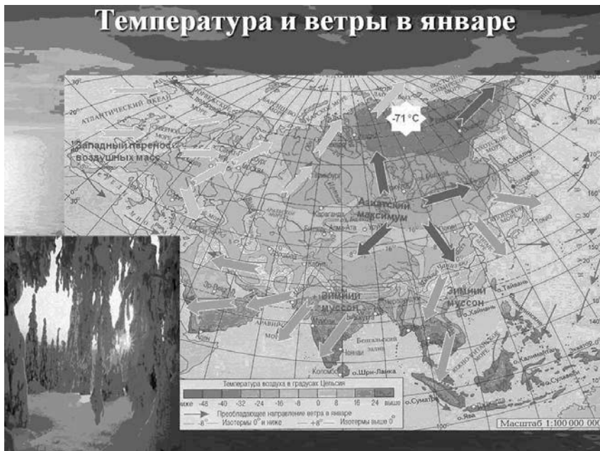
Рис. 5. Масштаб и направление зимнего муссона

Презентация учителя географии МОУ гимназия №54 г. Краснодара А.В. Эсауленко.