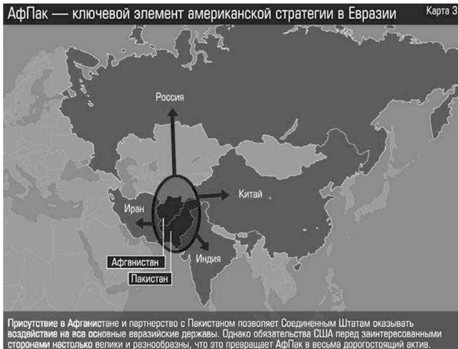
Рис. 4. Спектр влияния «афгано-пакистанского» узла (см. Быков П. Геополитика реиндустриализации (Geopolitics of Re-industrialization) // Эксперт , 2012, № 9 (792). Режим доступа: http://expert.ru/expert/2012/09