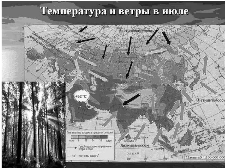
Рис. 6. Масштаб и направление летнего муссона

Презентация учителя географии МОУ гимназия №54 г. Краснодара А.В. Эсауленко.