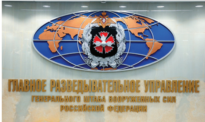
Коридор в Главном разведывательном управлении (ГРУ)

Конечно, нет абсолютных правовых, нравственных норм, неизменных во все времена от сотворения мира. Их конкретное наполнение зависит от времени, в котором живет человек, от законов страны и обычаев своего народа, от нравственного кругозора социальных групп, которые он представляет. Мы живем не в безвоздушном пространстве. Поэтому для нас, россиян, приемлемо все, что с соблюдением норм внутрироссийского и международного права делает нашу страну могущественнее и в военном, и в со-