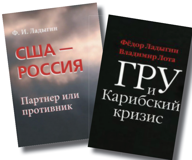
Книги Федора Ивановича Ладыгина

ральна ли деятельность в течение длительного времени в сороковые годы в Европе и США военных разведчиков-нелегалов Героев России Яна Черняка, Артура Адамса, Жоржа Ковалья, доставших огромное количество документов по американской ядерной программе и выносивших в своих карманах радиоактивные образцы?! И таким примерам несть числа!